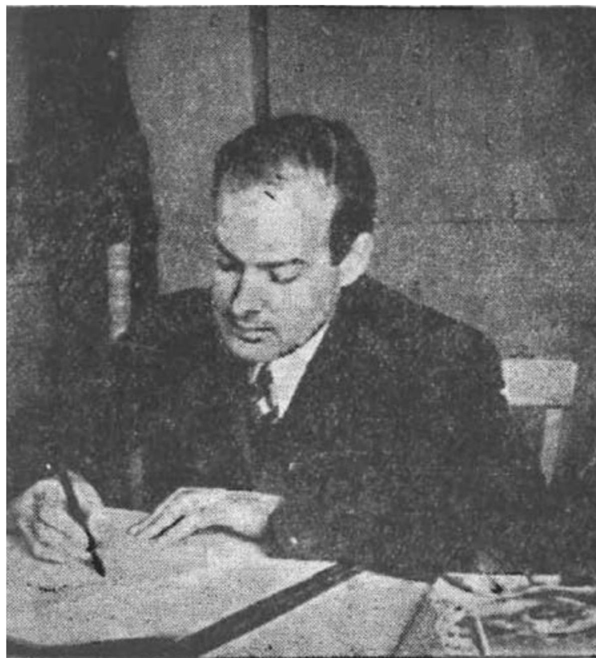
ENRIQUE BUNSTER Autor de la obra: "La Isla de los Bucaneros"