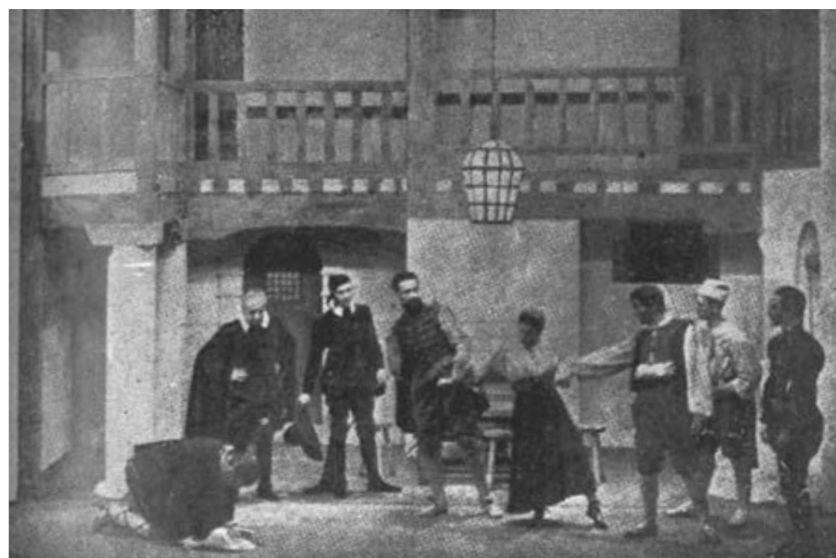
Escena de la primera representación de Dulcinea , en París. Realización de Gaston Baty. arriba: parte I / abajo: parte II.